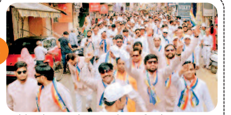
घोड़े और ऊंट के साथ निकाली शोभायात्रा...